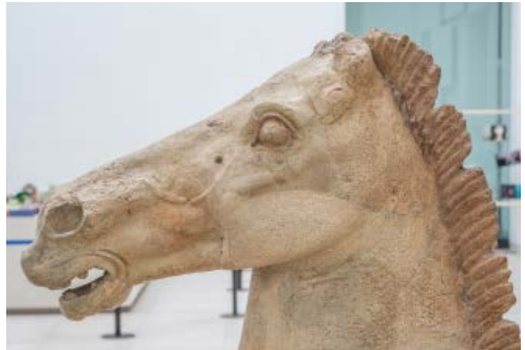
Durante il restauro, particolare con la testa del cavallo, tracce di colorazione aranciata