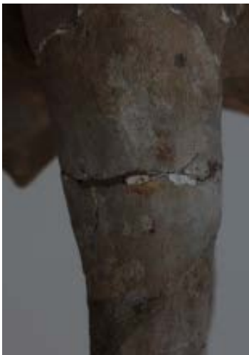
Durante il restauro, particolare con la zampa del cavallo: tracce di colofonia dalla tipica colorazione rossa, impiegata per l'assemblaggio dei frammenti negli anni Venti del Novecento

no velato la superficie, l'attuale restauro ha restituito coesione ai frammenti e ha proceduto a eliminare sostanze organiche e grasse dovute ad alcune modeste manutenzioni della statua fittile posteriori al 1925.