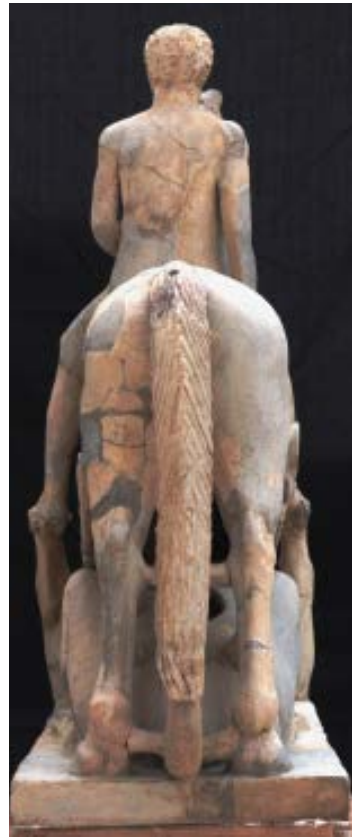
Prima del restauro, visione posteriore