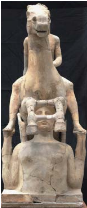
Prima del restauro, visione frontale