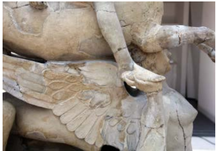
Prima del restauro, particolare con l'ala destra della sfinge