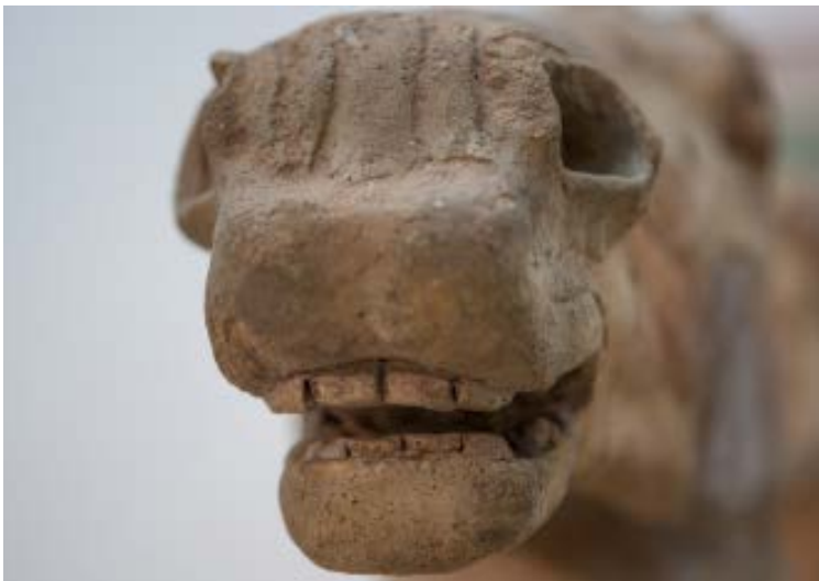
Durante il restauro, particolare della testa del cavallo con la mandibola a modellazione piena e precisi dettagli descrittivi