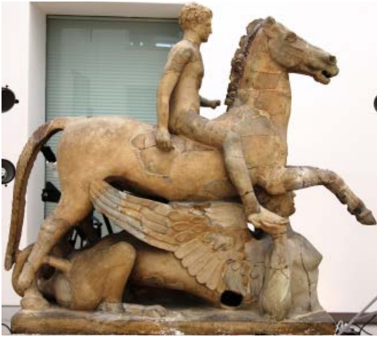
Prima del restauro, visione laterale destra