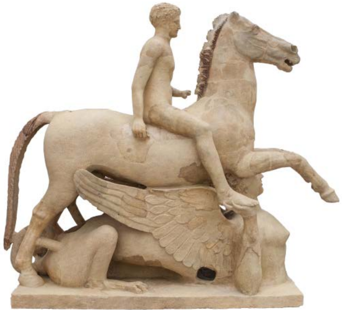
Dopo il restauro, visione laterale destra

Al termine del nuovo intervento, il Cavaliere Marafioti ha rivelato quasi inaspettatamente numerose tracce della policromia originaria ottenuta mediante ingobbi pigmentati con ossidi metallici (manganese, ferro). La statua ha così riacquisito porzioni dei colori (nero, bianco, rosso arancio va-