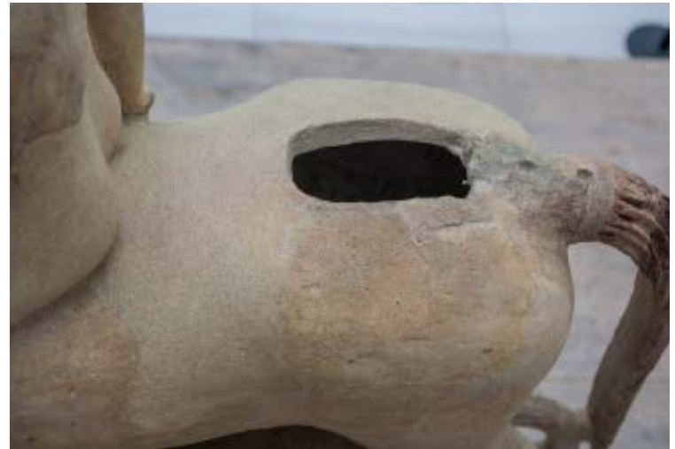
Durante il restauro, particolare con la groppa del cavallo: foro di sfianto indispensabile per la cottura della terracotta

custodiva le tavolette di bronzo con la contabilità del santuario di Zeus Olimpio ( Polis ed Olympieion 1992).