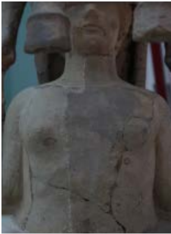
Durante il restauro, particolare con la sfinge, fase di pulitura: tassello che evidenzia il recupero di porzioni originali