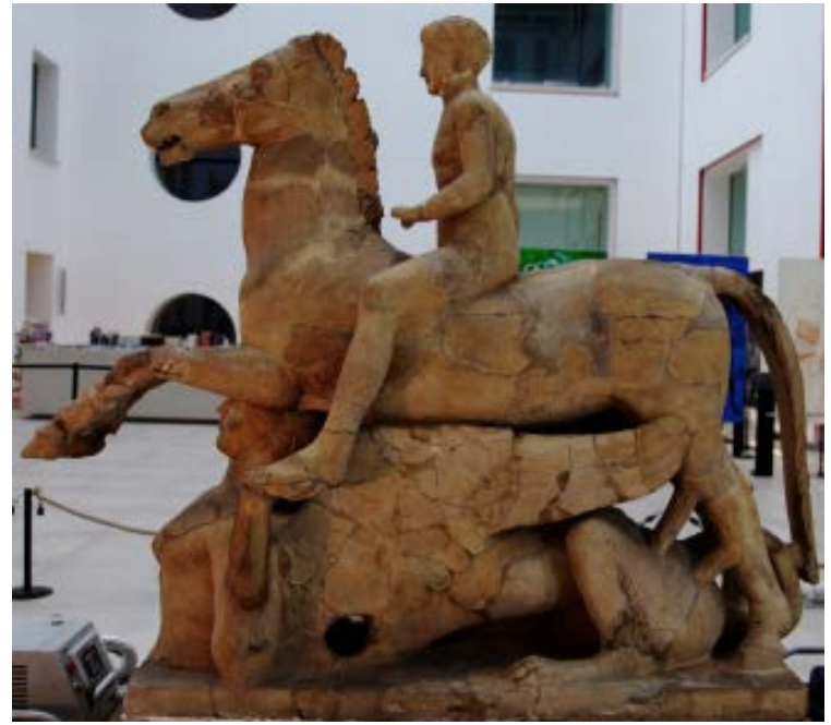
Prima del restauro, visione laterale sinistra

menti dispersi su un'area più vasta (la questione che è prettamente archeologica non può essere qui affrontata).