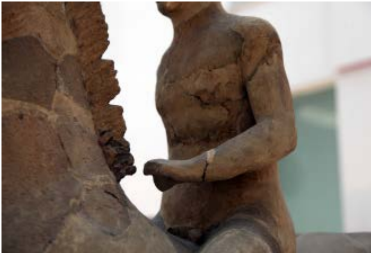
Prima del restauro, particolare con il cavaliere che regge le briglie