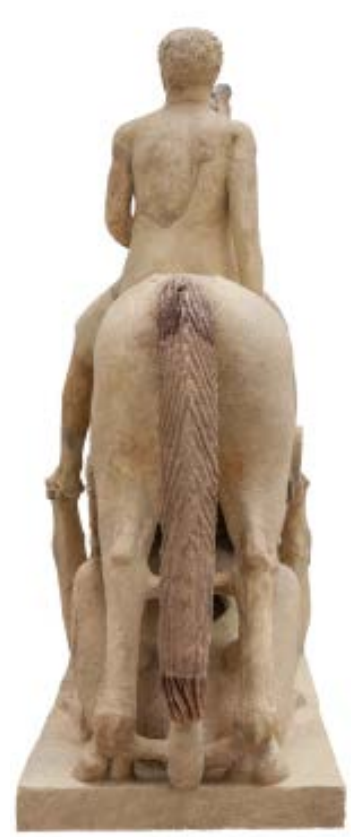
Dopo il restauro, visione posteriore

a.C. circa), descritto da PAUS, III, 18, 14: «Vicino alle estremità superiori del trono sono rappresentati, uno per lato, i figli di Tindareo a cavallo [sc. i Dioscuri]. Ci sono sfingi sotto i cavalli, e belve che corrono verso l'alto» (trad. Torelli) (SZELIGA 1982, p. 72; DE LA GENIÈRE 1983, pp. 167-168; HERMARY 1986, p. 570 nr. 20; e specialmente FAUSTOFERRI 1996, ad locum ).