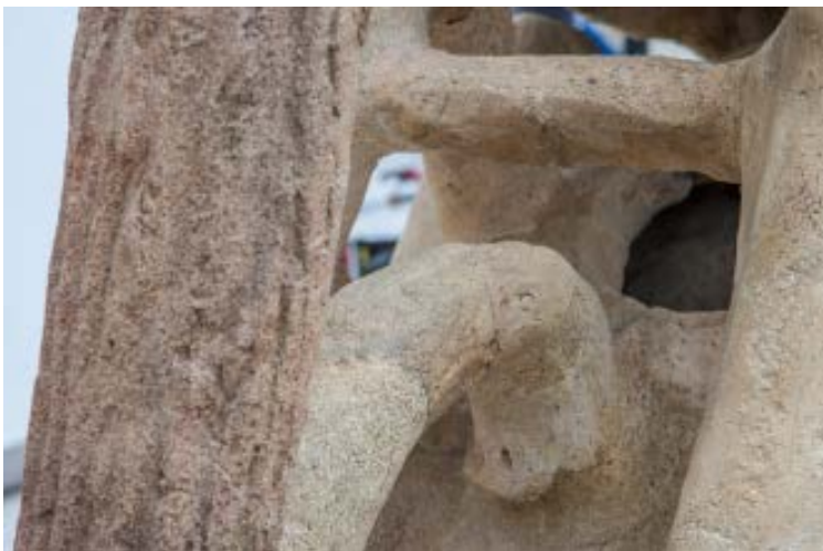
Durante il restauro, particolare con la schiena della sfinge: foro di sfiato indispensabile per la cottura della terracotta