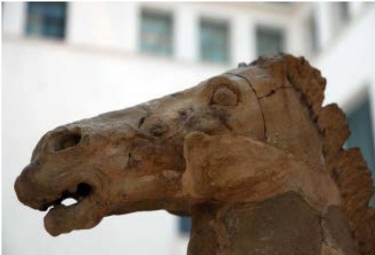
Prima del restauro, particolare con la testa del cavallo