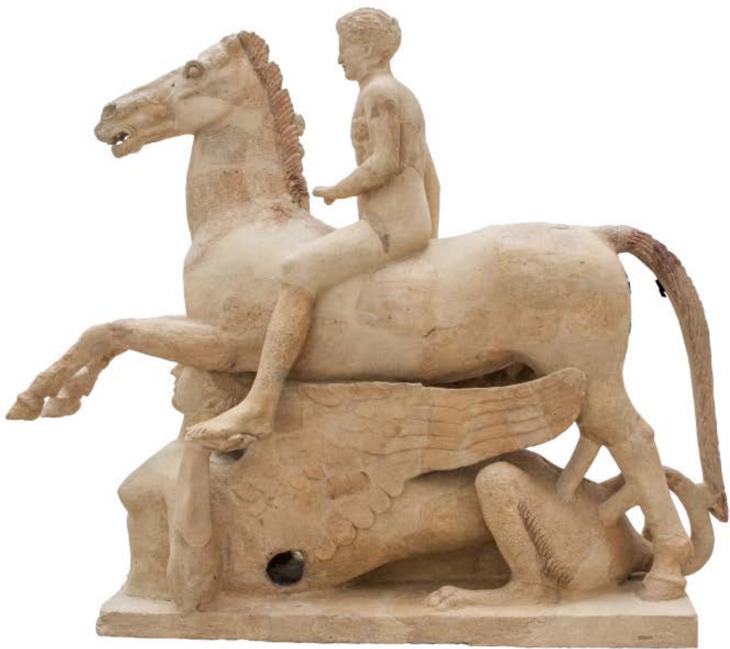
Dopo il restauro, visione laterale sinistra