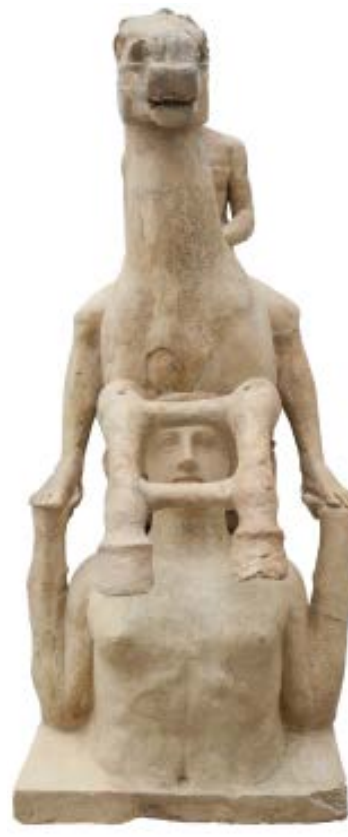
Dopo il restauro, visione frontale