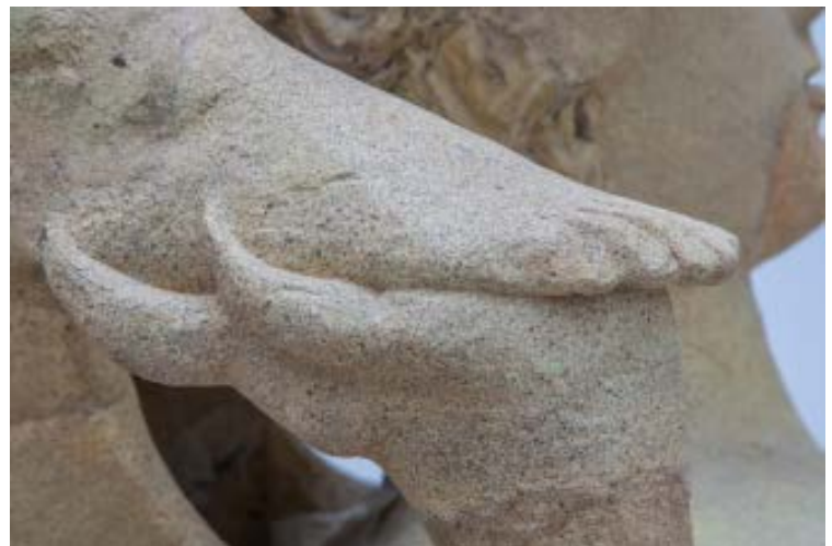
Durante il restauro, particolare con il piede del cavaliere: fase di ritocco cromatico 'puntinato' per evidenziare le integrazioni